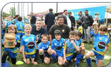
Et carton plein pour SFRL avec les U8,...