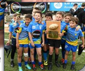
et les U12 !