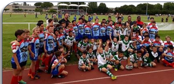
Les Poussins, Benjamins des clubs du Rhône et les jeunes de LVR/VVRL