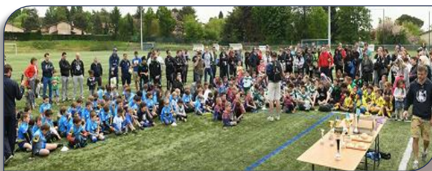
Attente des résultats et de la remise des récompenses