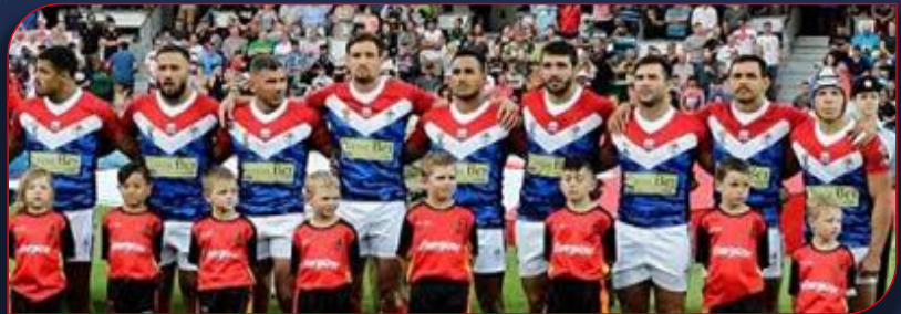
Le XIII de France lors de la coupe du Monde 2017 en Australie

Novembre Irlande – France et Ecosse – Pays de Galles ; 10/11 Novembre Pays de Galles – Irlande et France-Ecosse.