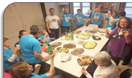
Cocktail convivial pour clôturer le programme Silver XIII

individuellement à chaque participant avec des conseils. Un moment festif a ensuite