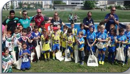
La joie des U6 avec les médailles et le cadeau souvenir

position devant la formation de Caluire 1, les locaux de LVR VVRL, Décines RL, SFRL3 et Mably. Dans la catégorie benjamins (U12), ce sont les locaux de l'entente LVR et VVRL qui conservent la pole position devant les Lions de SFRL et la formation de Caluire RL/Décines /CTRL.