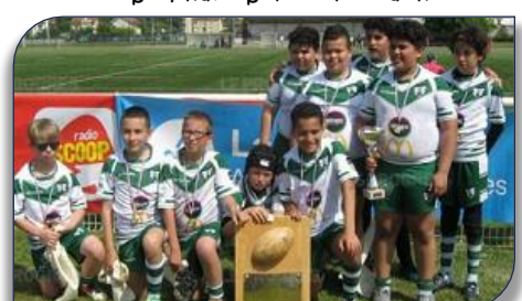
Les U12 de LVR VVRL avec le trophée et la coupe

Un grand Merci aux parents, éducateurs, arbitres bénévoles, et toute l'équipe de Bénévoles des clubs de LVR - VVRL pour la parfaite organisation de cette septième étape qui s'est déroulée sous le soleil. Rendez-vous à tous pour la finale et le tournoi Michel DEBEAUX qui aura lieu le 16 Juin prochain au stade Troussier de Décines avec la participation de clubs extérieurs à la Ligue AURA.