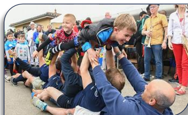
La danse du Paquito avec les enfants tout sourire et aussi des parents... !!