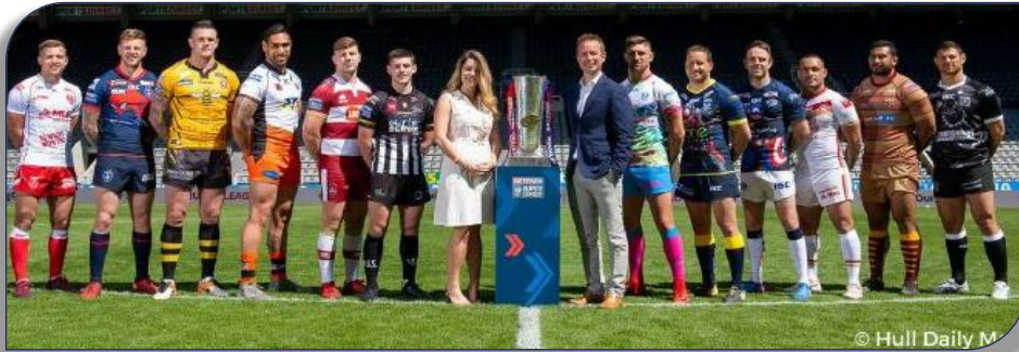
Les Capitaines des équipes participant au Magic Week end autour du Trophée