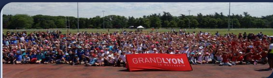
Les participants de la 13ème édition du Challenge Petit treize au Parc de Parilly le 9-06-17 (plus de 1400 scolaires)

La quatorzième édition du Challenge Petit Treize organisée par la Ligue Auvergne-Rhône-Alpes et le Comité du Rhône et Métropole de Lyon de Rugby à XIII aura lieu le 1 er Juin au Parc de Parilly . Le nombre de participants va encore cette année établir un record avec plus de 1700 scolaires en provenance des écoles primaires de la Métropole de Lyon affiliées à l'UGSEL, rassemblés tous pour une même cause, le plaisir de pratiquer le ballon Ovale grâce au Rugby à XIII. Alors retenez dès maintenant cette date car il faudra des bénévoles et des arbitres pour permettre à tous de participer à cette fête de l'Ovalie.