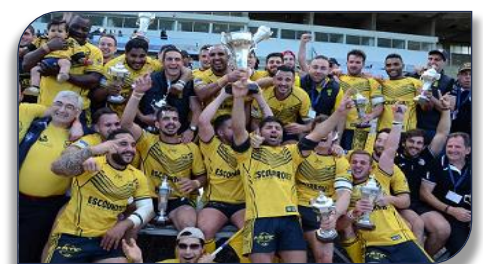
La joie des canaris de l'AS Carcassonne vainqueur l'an dernier