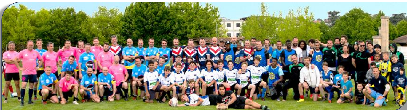
Plan large sur les participants à la cinquième étape du Challenge Bernard Vizier à Sainte-Foy les Lyon

renforcés par des joueurs du LVRXIII qui ont terminé en pôle position devant Caluire, les blue Lyons et les deux équipes de Sainte Foy Rugby League. La prochaine étape aura lieu pour la finale qui aura lieu le samedi 16 Juin à Décines.