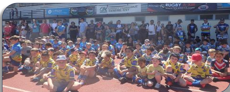
Attente des résultats lors de la finale du Challenge Avenir AURA 2017 à Décines