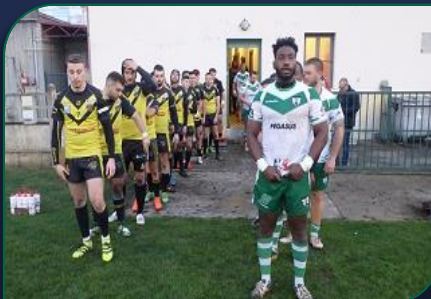
Sortie des joueurs des deux équipes LVR et Salon

Face à la lanterne rouge Salon, les joueurs du LVR XIII auront mis une mi-temps à dompter les ardeurs offensives des Provençaux qui menaient 8 à 6 à la pause. Après les citrons, l'attaque du LVR XIII allait se montrer plus réaliste et sous un bonjour en inscrivant quatre essais dont trois par son centre Anchidine contre un seul essai aux visiteurs. Le score de 30 à 10 indique la supériorité de l'attaque des verts et blancs. Il faudra maintenant confirmer dès ce dimanche en déplacement à Entraigues. Pour le compte de la coupe de France lord Derby, les joueurs de l'entraîneur Sébastien Aguerre se déplaçaient à Montpellier et les Rhodaniens ont atomisé la formation Montpellieraine par 68 à 00. Ce succès donne ainsi un billet pour les huitièmes aux joueurs rhodaniens.