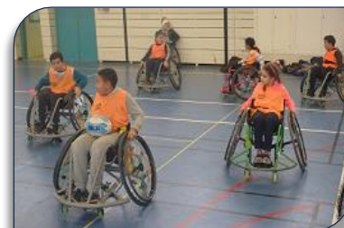
Initiation au Rugby XIII Fauteuil