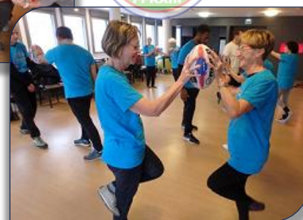
Renforcement musculaire avec ballon