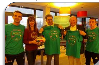
Présentation de Silver XIII au Président de la Métropole