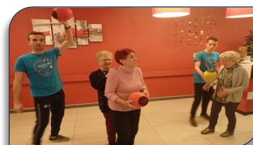
Initiation à un atelier Silver XIII Equilibre

Les atouts du programme ont aussi été remarqués par plusieurs correspondants de la presse présente (France 3 - TLM - RCF - Journal les Echos et le Progrès de Lyon)