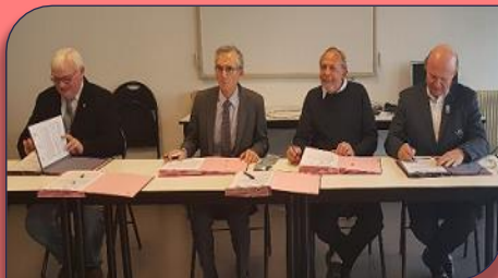
Signature de la Convention par les deux présidents