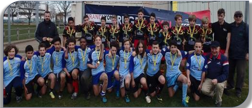
Les Collégiens de Feurs et Décines Maryse Bastié en Mars dernier à Décines

Les entraînements Rugby à XIII pour les benjamins et Minimes du Collège Aimé Césaire se sont poursuivis en décembre. Les inscriptions pour la participation au championnat de France UNSS Rugby à XIII qui aura lieu cette année en Mai à Cahors se sont terminées le 15 Décembre. Il y aura des rencontres académiques inter-collèges minimes garçons qui auront lieu le 6 mars prochain entre les collèges de Feurs – Décines Maryse Bastié – Décines Brassens et le collège de Montréal la Cluse. Le vainqueur représentera la Ligue AURA au Championnat de France.