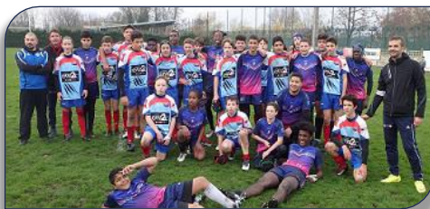
La formation de Marseille et de Lyon Métropole XIII