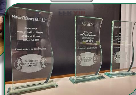
Les trois trophées remis aux Lionnes