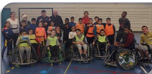
Le groupe CM1 CM2 de l'école Prainet 2 de Décines et les animateurs