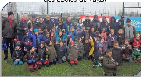
la Catégorie U7 avec les médailles et les personnalités présentes