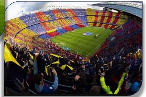
le stade de Camp Nou lors d'une rencontre du Barça