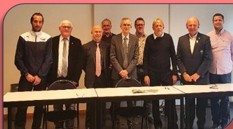
Les personnalités et Présidents de comité autour de l'inspecteur

Cette convention va permettre d'introduire l'enseignement du rugby à XIII dans le temps scolaire des écoles publiques du Rhône et Métropole de Lyon par les enseignants dans de bonnes conditions d'efficacité et de sécurité comme cela a été fait en Juin dernier