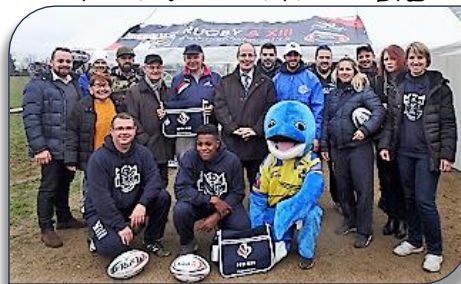
Les personnalités autour des dirigeants du club DRL