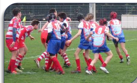
Les Lions face aux minimes de Carpentras