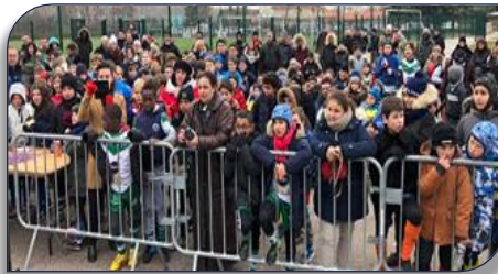
Attente des résultats pour les jeunes des écoles de rugby

Après un casse-croûte vite avalé, les jeunes reprenaient pour les dernières rencontres et dans la catégorie U13, une initiative intéressante a été mise en place pour la première fois avec une rencontre à 13 contre 13 qui a satisfait l'ensemble des joueurs et éducateurs et qui sera renouvelée dans les prochaines étapes.