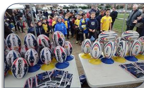
Une pluie de ballons pour les jeunes dauphins de DRL