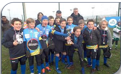
la joie des lions U13 de SFRL sur le podium

En Benjamins (U13) avec 4 équipes, ce sont les lions de SFRL1 qui se glissent en pôle position et SFRL2 devant LVR/VVRL/DRL/CTTRL et Caluire. A noter une initiative intéressante dans cette catégorie qui a été expérimentée ce jour en permettant aux 4 équipes de jouer la deuxième phase à 13 joueurs. Dans ces rencontres, l'OUEST 1 et 2 l'emportent sur les représentants de l'EST 1 et EST2. L'ensemble des joueurs et éducateurs ont apprécié ce changement et l'intérêt sera à confirmer lors des prochains tournois.