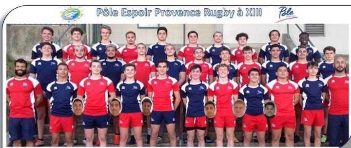
La promotion 2020-2021 du Pôle Espoir Provence Rugby à XIII avec les 3 rhodaniens