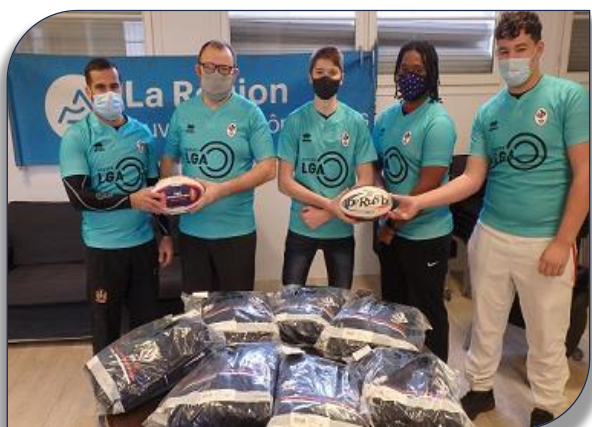
Les arbitres de la ligue recevant la dotation 2020-2021

météo hivernale. Ils espèrent pouvoir l'utiliser au plus vite quand la compétition va reprendre en 2021.