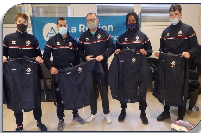
Les arbitres de la Ligue AURA avec la nouvelle tenue