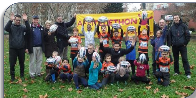
Les jeunes tigres après la course du TeletthonKin

En cette année pas comme les autres, l'Office du Sport Villeurbanne a décidé de maintenir la cérémonie des Lauriers selon des modalités inédites en distanciel. Le thème de l'engagement était au cœur de cette édition où sont mis en lumière des entraîneur-euse-s et des clubs pour l'exemplarité de leurs actions citoyennes. C'est ensuite un jury de 12 personnes, avec un 13e juré grand public (vote en ligne), qui a élu un-e entraîneur-euse, un club "éducation et égalité", un club "loisir et santé" et un club "solidarité et éco-responsabilité". Dans la catégorie Club " SOLIDAIRE et ECO-RESPONSABLE" c'est le Club local des Tigers de Charpennes Tonkin qui a remporté le Laurier avec une intervention de