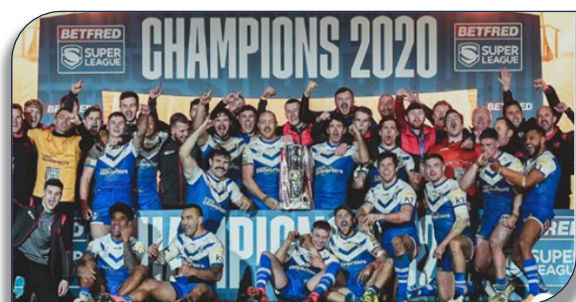
La joie de la formation des Saints de St Helens avec le trophée

La Super League rendait son verdict fin novembre avec un affrontement au sommet entre Wigan et St Helens, qui ont dominé la saison régulière de Super League. Avant même le match, tous les fans savaient à quoi s'attendre, une finale serrée, tendue et avec beaucoup de combat. La pause est atteinte sur le score de 2 à 0 pour les Saints. Coote redonne confiance aux warriors à l'heure de jeu par un essai en bout de ligne un score de 4 à 4. Il reste moins de 5 minutes à jouer et la tension monte d'un cran. Le catalan Théo Fages est le premier à dégainer un drop lointain mais sa tentative est trop courte et Wigan récupère le cuir. Les Saints se mettent à la faute et offrent une pénalité à Wigan. Hardaker la tente mais c'est également trop court. Les deux équipes sont toujours au coude à coude. Mais la dernière minute est folle, Makinson tente un nouveau drop qui frappe le poteau droit, rebondit, passe par dessus la barre et retombe dans l'en-but de Wigan. Welsby a bien suivi et vient inscrire un essai, synonyme de titre pour les Saints. St Helens conserve donc son titre avec cette victoire 8-4 et après une fin de match totalement folle ! Le catalan Theo Fages remporte là son deuxième titre de Champion.