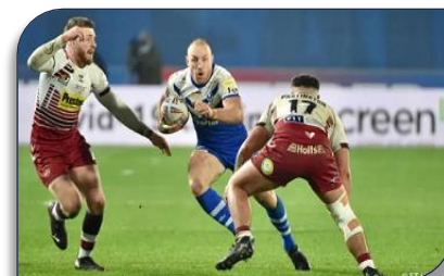
Une charge de James Roby face à Wigan

Au terme d'une finale très fermée et haletante, le titre d'homme du match est revenu à l'éternel talonneur anglais des Saints. James Roby a remporté le Harry Sunderland Trophy après la victoire sur le fil de St Helens face à Wigan sur le score de 8-4. Travailleur de l'ombre, il a été très utile dans un match très défensif. Auteur de 56 plaquages, il remporte le titre pour la 2ème fois après 2014, où il était déjà question d'une finale remportée face à Wigan. Roby 35 ans remporte pour la 4ème fois la Super League avec les Saints et rejoint des joueurs comme Danny McGuire, Andy Farrell, Rob Burrow ou Kevin Sinfield