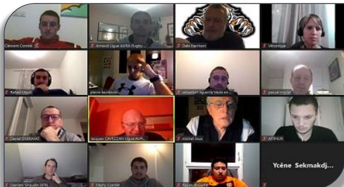
Une vue des participants à l'AG du Comité RML de Rugby à XIII