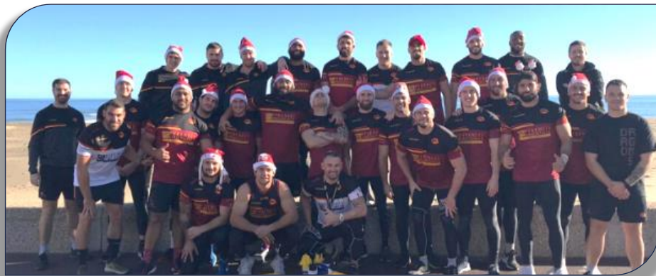
Le squad des Dragons Catalans va profiter de quelques jours de vacances