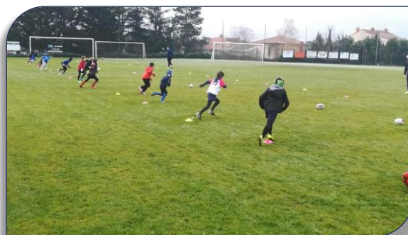
Feu vert pour la reprise en décembre pour CRL, CTTRL, DRL, LVR, SFRL et VVRL

Le nouveau confinement du mois Novembre avait donné lieu à l'organisation de séances en visio dans plusieurs clubs. Dès que l'autorisation fut donnée de reprendre une activité individuelle en extérieur, plusieurs écoles de Rugby ont repris dès le Mercredi 2 Décembre. Les activités se sont évidemment adaptées au respect du protocole sanitaire, tout comme certains l'avaient fait au mois de Juin. Les jeunes rugbymen et rugbywomen ayant repris le chemin du terrain, ont immédiatement repris le sourire, aussi impatients que motivés et heureux.