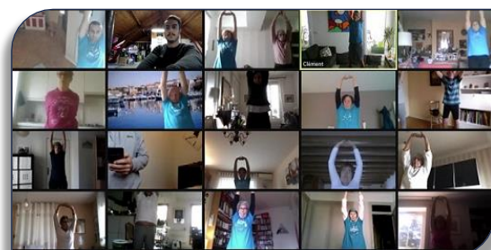
Les participants à une séance en Visio-conférence

Depuis fin Octobre et la mise en place du deuxième confinement, l'équipe technique de la Ligue AURA et du Comité du Rhône ont mis en place un programme d'activités physiques à distance par visio-conférence trois fois par semaine, avec des séances de 30 minutes. Chaque séance est composée d'un échauffement avec des marches, un renforcement musculaire, des ateliers équilibre, motricité, coordination et se termine par des assouplissements et un exercice de chorégraphie sur le thème du Hakka des joueurs Néozélandais. Un programme varié et dynamique qui rassemble un quarantaine de seniors devant leur écran. Une évaluation à chaud fait apparaître un vrai plébiscite pour ce nouveau programme qui n'est plus limité à un nombre de participants comme en présentiel en période de crise sanitaire. Rendez vous à tous début Janvier 2021