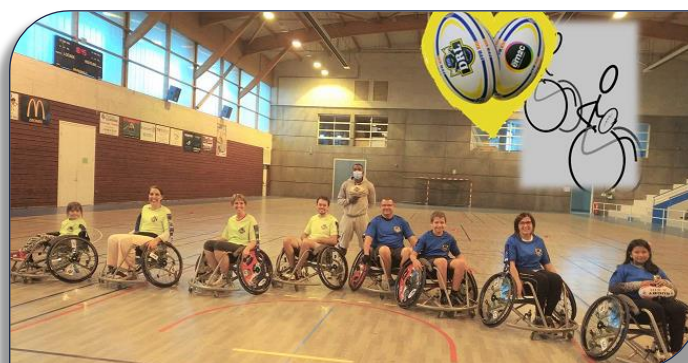
L'équipe du Décines RL à l'entraînement

Cela dit, il en faudrait plus pour démotiver l'équipe du DRL qui poursuit son travail « en off » pour trouver des partenaires. Nous avons fait de l'Endurance et de la Régularité l'ADN de nos projets !