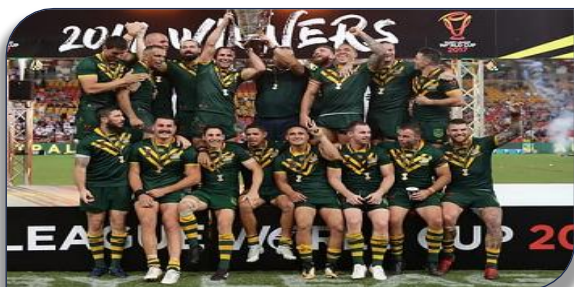
Les Australiens vainqueurs de la dernière édition face à l'Angleterre

La formule de l'édition 2021 se déroulera du 23 octobre au 27 novembre en Angleterre et comprendra 16 nations. Le format de ce Mondial sera composé de quatre poules de quatre nations. A l'issue de cette phase qualificative le premier et le second de chaque poule seront qualifiés pour les quarts de finale. La France hérite du groupe A composé de Angleterre-Samoa-Grèce . La poule B sera composée de Australie-Fidji-Ecosse-Italie. La Poule C avec Nouvelle-Zélande-Liban-Jamaïque-Irlande. La Poule D avec Tonga-Papouasie Nouvelle Guinée-Pays de Galles -Iles Cook. Les deux premiers de chaque poule seront qualifiés pour les quarts de finale. Pour les Féminines, le niveau sera aussi très relevé avec Australie-Nouvelle Zélande-Iles Cook. En Rugby Fauteuil, la France hérite de l'Ecosse, du Pays de Galles et des Etats Unis. Des rencontres relevées que les tricolores vont préparer dès Avril.