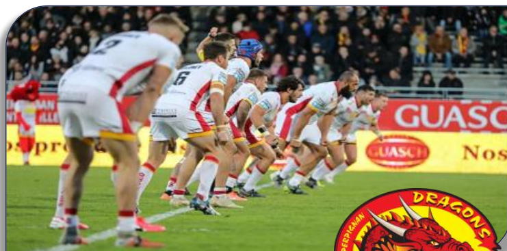
Les Dragons Catalans sur la ligne de départ

Le coup d'envoi de la saison 2021 de Super League a été décalé et le championnat débutera finalement le 25 Mars prochain. La saison devait initialement débuter le 11 Mars mais suite à la pandémie et à des discussions avec Sky Sports, les clubs de Super League ont accepté de repousser le coup d'envoi de deux semaines pour augmenter les chances de lancer la nouvelle saison devant du public. La Super League continue de travailler sur le calendrier, dont les détails seront dévoilés prochainement. Cela ne remet pas en cause la date de fin de la saison, la Grande Finale restant programmée le 9 Octobre à Old Trafford à Manchester.