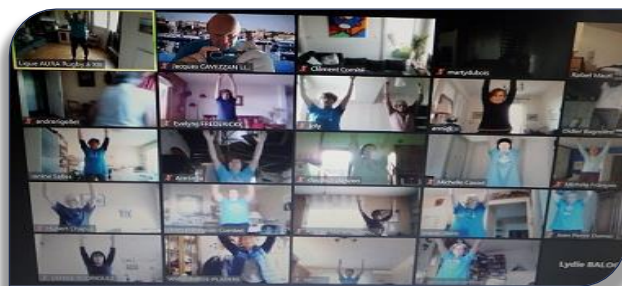
Les séniors lors d'une séance Silver XIII Equilibre en distanciel

Depuis le deuxième confinement de Novembre, l'équipe technique de la Ligue AURA et du Comité du Rhône a mis en place un programme d'activités physiques adaptées à distance par visio-conférence trois fois par semaine, avec des séances de 30 minutes. Chaque séance est composée d'un échauffement avec des marches, un renforcement musculaire, des ateliers équilibre, motricité, coordination et se termine par des assouplissements et un exercice de chorégraphie sur le thème du Hakka des joueurs Néo-zélandais. Un programme varié et dynamique très apprécié qui rassemble une quarantaine de séniors devant leur écran à chaque séance, en attendant le retour dans les salles au printemps.