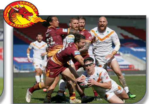
Les dragons inscrivent le premier essai face aux Giants