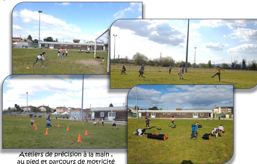
Ateliers de précision à la main , au pied et parcours de motricité

Il s'agit pourtant d'un rdv attendu pour les jeunes décinois, licenciés ou non, à chaque période de vacances scolaires ... Les membres de l'équipe dirigeante furent unanimes : « L'ESSENTIEL est de maintenir nos jeunes en contact et en extérieur avec des activités physiques ». Le programme s'est vite adapté sur les 2 semaines de vacances avec des ateliers aussi divers que ludiques et sportifs les Lundi, Mercredi et Vendredi après-midi ... autour d'Halidi et de Mélanie. L'appel a été très bien entendu et les créneaux proposés ont tous fait le plein : les parents et les enfants partageaient le même constat et la même envie !