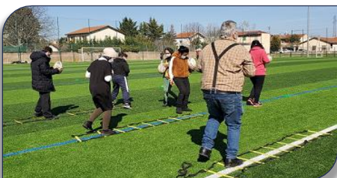
atelier motricité avec le premier groupe

3 groupes de 12 personnes ont été retenus par la société Sonkei RHL et l'entreprise Platinum Formation qui ont sollicité l'association 10 pour 10 pour la mise en place d'activités physiques telles que la boxe, la course d'orientation et un sport collectif le Rugby à XIII réalisées par des clubs locaux partenaires.