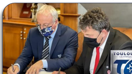
Les deux Présidents lors de la signature du Contrat