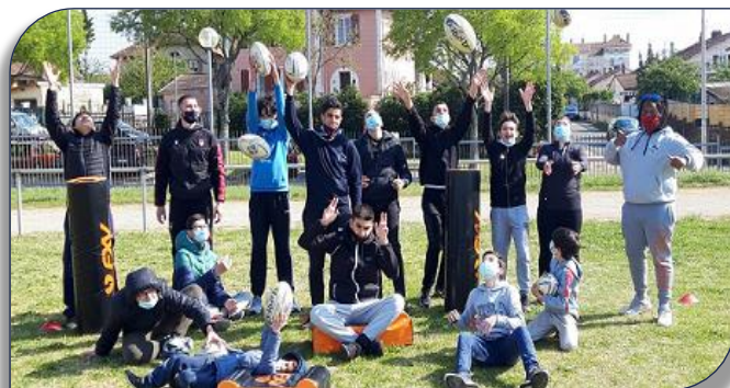
Haut les ballons pour le groupe de stagiaires