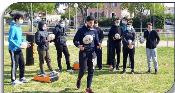
Démarrage d'un atelier motricité