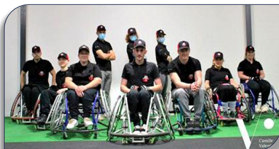
l'équipe des Tigres Blancs du Para Rugby 13 de Valence