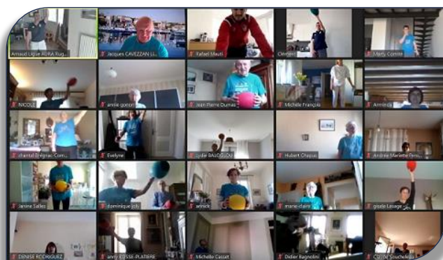
Les participants aux séances Silver XIII Equilibre

Depuis le 2 Novembre dernier, les séances en distanciel du programme Silver XIII Equilibre se poursuivent le lundi, mercredi et vendredi de 10H à 10H35 avec les animateurs du Comité du Rhône et de la Ligue AURA. Un petit clic sur un lien reçu en début de semaine, et chacun peut à son domicile effectuer des ateliers de renforcement musculaire, équilibre, coordination et assouplissements qui se terminent par une chorégraphie avec Marty. Depuis le 2 Novembre, près de 70 séances Silver XIII Equilibre auront été organisées par les animateurs avec plus de 30 participants à chaque séance. A partir de début Mai, des ateliers en présentiel vont se mettre en place en extérieur si la crise sanitaire le permet, en particulier sur Rillieux la Pape, Neuville, Décines, Vaulx en Velin, Lyon Gerland et Corbas.