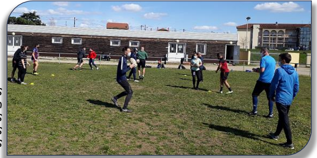
Ateliers progression pour les stagiaires éducateurs