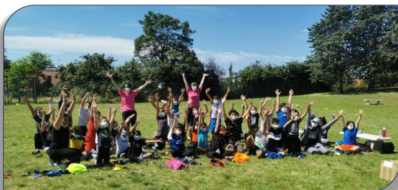
Des enseignantes à fond dans le projet

Depuis, tous les ans, 11 à 12 classes de Décines sont initiées au Rugby à XIII par l'éducateur du Décines Rugby League. Cette année particulière n'a pas fait exception, même s'il a fallu s'adapter aux conditions. Point d'orgue en ce début de mois de Juillet à l'Ecole du Prainet 2 où un interclasses a été organisé avec succès !