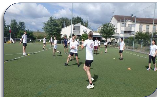
atelier vague de passes à Dardilly

Un t-shirt aux couleurs du club Roannais, de la Ligue AURA de Rugby à XIII et de la Région Auvergne-Rhône-Alpes a été remis en souvenir à chaque jeune du SNU et aux encadrants.