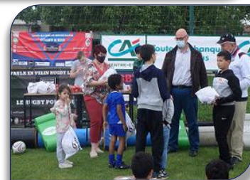
Remise du ballon à la catégorie U9

depuis le début de l'année par les animateurs bénévoles du club. Ils sont conviés à la fête de l'école de rugby du LYON Villeurbanne Métropole XIII pour cette dernière séance Rugby ". L' Objectif est atteint avec effectivement beaucoup de sourires et de bonne humeur présents sur tous les visages de ces futurs rugbymen, et on a pu voir même des étoiles dans les yeux de certains enfants, le tout sous un chaud soleil printanier! Le Président de la Ligue AURA Jacques Cavezzan a ensuite remis aux licenciés du club les ballons de la FFR XIII de l'opération "un ballon pour tous " et a remercié les éducateurs bénévoles du club présents toute l'année.