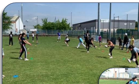
Echauffement des scolaires avec le ballon ovale