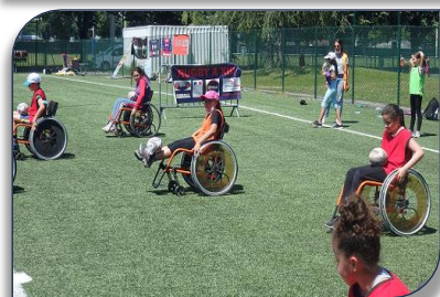
Les jeunes CM1/CM2 de l'école Anatole France de Villeurbanne