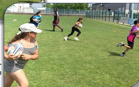
atelier course avec ballon