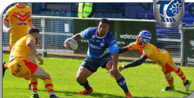
Contre-attaque du TO XIII face aux aigles de Sheffield