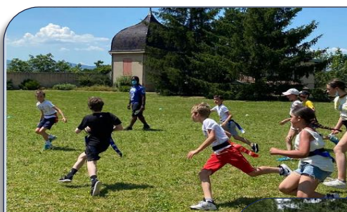
Rencontres Petit treize à l'École St Denis de la Croix Rouse

Les initiations dans les écoles primaires affiliées à l'UGSEL de la Métropole de Lyon ont permis pendant le mois de Juin à des centaines d'élèves de CE2, CM1 et CM2 de clôturer cette année scolaire particulière par des rencontres interclasses dans leurs établissements comme à l'école Ombrosa et à l'Oratoire de Caluire, à l'école St Joseph de Lyon-Brotteaux, à l'école Notre Dame de Sainte Foy-lès-Lyon, et à l'école St Denis de la Croix-Rousse. Au total plus de 1500 jeunes en provenance de 15 écoles primaires de la Métropole de Lyon auront bénéficié des séances d'apprentissage des cycles Petit Treize sur toute l'année scolaire ainsi que 2 classes de 30 élèves de la ville de Roanne. Le tournoi annuel qui avait lieu chaque année en juin a dû être annulé à cause de la crise sanitaire. Rendez-vous à tous dès le mois de septembre pour la reprise des cycles et la reprogrammation des différentes écoles. Bonnes vacances à tous en attendant !