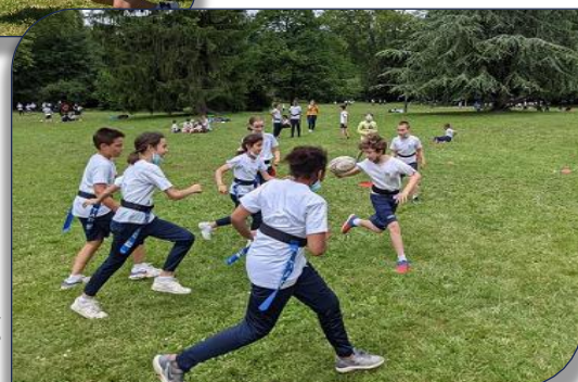
Rencontres des CM2 de l'école Ombrosa de Caluire