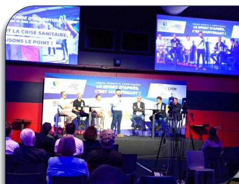
Au Matmut Stadium

Question : comment inventer un sport soucieux des nouveaux enjeux environnementaux, économiques et sociaux ? Le Silver XIII Equilibre, le Fit XIII Energie et les pratiques aménagées loisirs se placent dans les perspectives ayant du sens. Le développement au cœur du thème : « le sport d'après, c'est maintenant » .