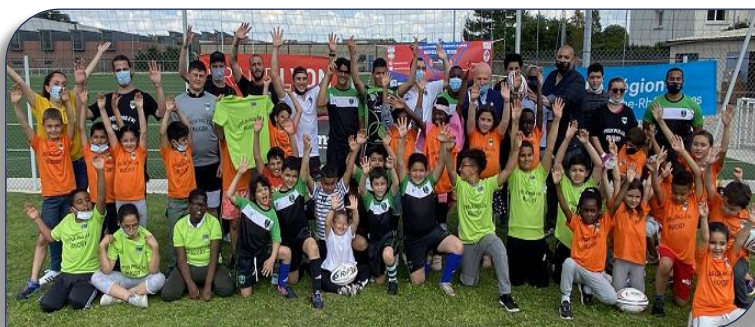
Le sourire des enfants présents à ce rassemblement Urban rugby

depuis le début de l'année par les animateurs bénévoles du club. Ils sont conviés à la fête de l'école de rugby du LYON Villeurbanne Métropole XIII pour cette dernière séance Rugby ". L' Objectif est atteint avec effectivement beaucoup de sourires et de bonne humeur présents sur tous les visages de ces futurs rugbymen, et on a pu voir même des étoiles dans les yeux de certains enfants, le tout sous un chaud soleil printanier! Le Président de la Ligue AURA Jacques Cavezzan a ensuite remis aux licenciés du club les ballons de la FFR XIII de l'opération "un ballon pour tous " et a remercié les éducateurs bénévoles du club présents toute l'année.