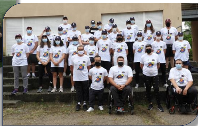
Les jeunes du SNU avec le T-shirt aux couleurs du Habndisport roannais et de la Ligue Aura de Rugby à XIII