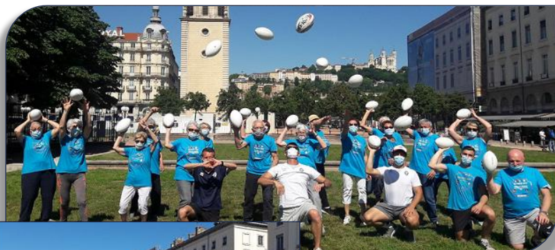
Les seniors pour la photo souvenir sur la place Antonin Poncet