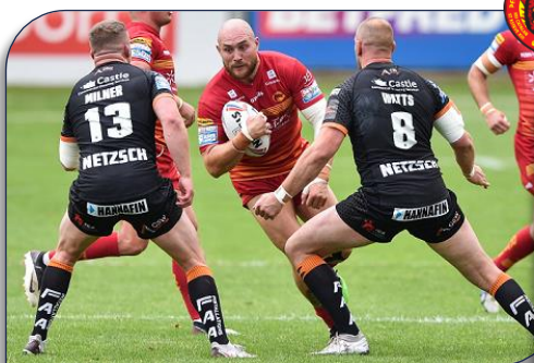
Les Dragons à l'attaque face à deux Tigres de Castleford