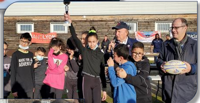
Remise d'un trophée aux jeunes de Charpenne Tonkin