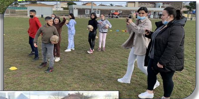
Atelier Précision avec les jeunes de Dolto