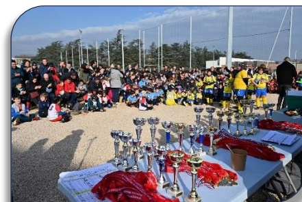
La troisième étape du Challenge sera disputée à Villeurbanne le 5 Mars