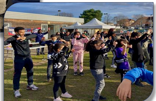
Spéctacle de danse avant la remise des récompenses