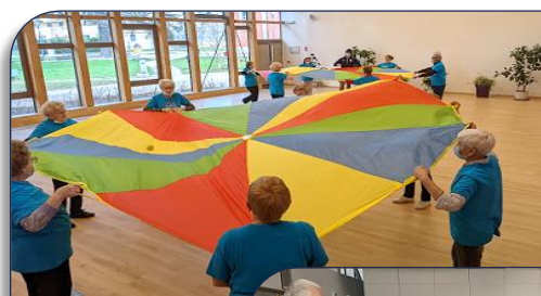
Séance silver XIII Equilibre avec le groupe de Givors

Suite à la collaboration développée avec l'Université de Lyon, la Ligue AURA de Rugby à XIII a reçu l'avis favorable pour l'attribution d'une bourse Cifre de l'ANRT (Association Nationale de Recherches et de la Technologie) pour une recherche qui sera effectuée avec le Laboratoire Interuniversitaire de Biologie de la Motricité de l'université Claude Bernard de Lyon 1. Le sujet de l'étude concernera l'évaluation des effets du programme cognitivo-moteur de prévention Silver XIII Equilibre sur les facteurs de risques de chute. Seront prises en compte les capacités fonctionnelles et les fonctions exécutives. Le chercheur qui est titulaire d'un master Activités Physiques Adaptées sera recruté par la Ligue AURA pour un contrat de travail de 3 ans qui débutera dès le 1 er Avril. En attendant les activités Silver XIII Equilibre se poursuivent avec les groupes de seniors de la Métropole de Lyon, du Rhône et de l'Ain. Un nouveau groupe va démarrer à Corbas le 4 Mars.