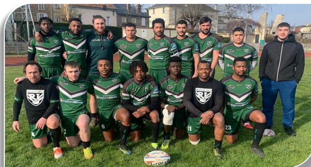
La formation des Lions de VVRL vainqueur à Corbeil