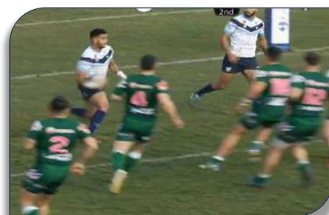
Sosthène Ennoyotie balle en main face à Lézignan