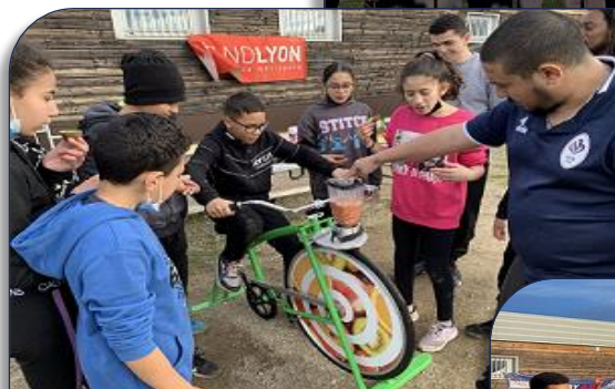
Amine du Tonkin prépare un smoothie à vélo