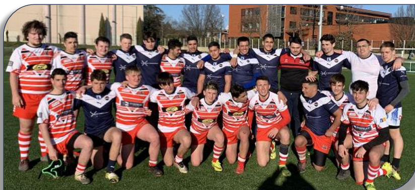
Photo souvenir des deux équipes de SFRL et Carpentras