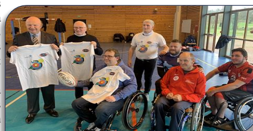
Remise des T-shirts aux animateurs et Directeur stage SNU