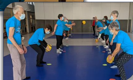
atelier Silver XIII avec les seniors de Caluire