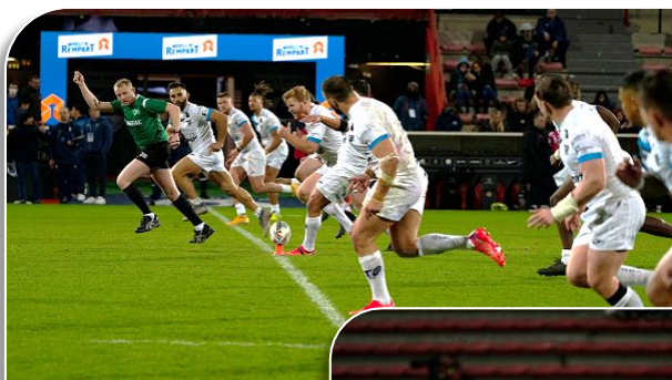
Coup d'envoi de la saison en Super League pour le TO

Pour l'ouverture de la saison à Ernest Wallon face aux « Giants » de Huddersfield les détonations des feux d'artifice lancés à moins d'une heure du coup d'envoi laissaient présager une ambiance conviviale pour cette grande première du TO en Super League. Les supporters des Bleus du TO trépignaient d'impatience de vibrer pour ce match historique. Dès le coup d'envoi les joueurs toulousains créent la surprise en inscrivant deux essais par Russel et Bergal et un score de 10 à 0 à la demi-heure de jeu avant d'assister à une « remontada » des visiteurs en particulier en deuxième période et une lourde défaite 42 à 14 des « Giants ». Pour la première sortie à Salford, et malgré un début de match difficile pour le TO, les hommes de Sylvain HOULES sont revenus dans le dernier quart d'heure de la première période avec un essai et une transformation de Chris Hankinson. La deuxième période s'est avérée plus compliquée pour Salford grâce à un jeu incisif des Olympiens, cédant moins de pénalités, revenant à 8 points au score et tenant jusqu'aux 10 dernières minutes. Un manque de précision sur la fin a permis à Salford de reprendre le dessus pour un score final de 38 à 12. Les deux prochaines rencontres seront décisives avec la réception des Loups de Warrington et de Wigan !