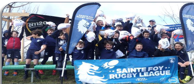
Remise des ballons aux jeunes U11 de SFRL en 2021

Le Comité Directeur de la FFR XIII a décidé de reconduire l'opération « un ballon pour tous » pour les catégories U5 - U7-U9-U11 et U13 des écoles de rugby à XIII. Comme la saison dernière, chaque enfant recevra en plus du ballon un protège dent pour encourager la pratique en toute sécurité. Au total il y aura 271 ballons pour ces jeunes des clubs de la Ligue AURA licenciés avant le 31 Janvier 2022 soit une augmentation de 5% des licenciés par rapport à Janvier 2021. Les ballons de la FFR XIII seront reçus début Mars à Lyon, et la cérémonie de remise des ballons aux licenciés sera organisée dès le 12 Mars par le club de SFRL à Sainte-Foy lès Lyon suivi de la remise des ballons le 19 Mars aux jeunes du DRL au stade Djorkaëff.