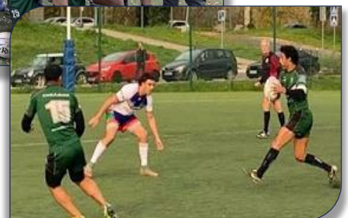
Un Cadrage de Tarek Jelaji