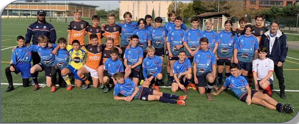
Les stagiaires U15 lors du premier Rassemblement de Sainte Foy les Lyon

C'est au stade du Plan du Loup à Sainte-Foy lès Lyon que s'est déroulé le 12 Novembre le premier regroupement des Joueurs U15 en provenance des clubs de SFRL -CRL – VVRL – DRL et US Domene. Au total 25 minimes (U15) ont suivi les ateliers mis en place par Christophe Chevalier et Quentin Galais afin de préparer les prochaines rencontres INTER-COMITÉS U15 qui se dérouleront cette année à Avignon les 25 & 26 Mars prochains . Un match à toucher a ensuite clôturé cette première journée de stage qui a été bien accueillie par tous les participants. Une deuxième journée aura lieu le samedi 17 Décembre à Sainte-Foy les Lyon avec les U13 et U15. Merci au club de SFRL pour l'organisation de ce premier rassemblement.