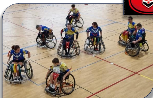
Les Lions Rocassiers défont la défense des Dahus d'Arbent

Ces derniers sont repartis imbattus sur cette étape. La jeune équipe du Décines Rugby League a pu prendre la température de ces rencontres et n'a pas démerité au vu des essais marqués et des commentaires encourageants des habitués du parquet.