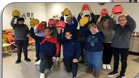
Haut les ballons avec les seniors de la résidence des 3 Bouleaux

LE PASS RÉGION AURA : La Ligue Auvergne Rhône-Alpes de Rugby à XIII a renouvelé le partenariat avec la Région pour la convention « adhésion » qui sera valable du 1 er Juin 2022 au 31 Mai 2023 à travers le Pass Région. La carte est gratuite et est accordée aux jeunes lycéens et apprentis de la Région, aux jeunes inscrits en classe de BTS âgés de 16 à 25 ans. Cette carte pluriannuelle est utilisable dans les librairies et lieux culturels et sportifs de Auvergne-Rhône-Alpes et permet une réduction de 30 € sur le règlement de la cotisation de la licence. Le service des Sports de la Région est à l'écoute des clubs, alors n'hésitez plus à les contacter pour toute demande d'information