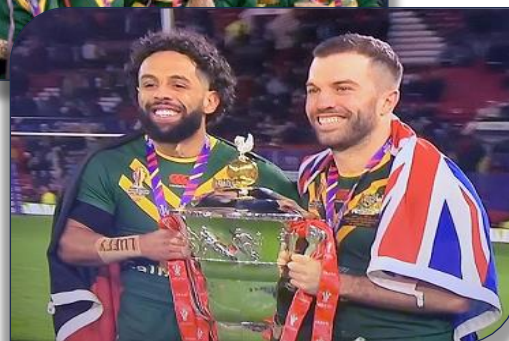
Josh Addo-Car et James Tedesco avec le Trophée Paul Barrière