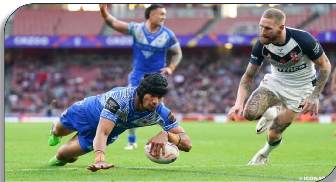
Le Samoan Stephen Crichton échappe à Sam Tomkins et marque

Quel match.. ! L'Angleterre et les Samoa ont livré l'une des fins les plus excitantes d'un match de rugby à XIII qu'il sera difficile de reproduire sur un terrain ! Une élimination de l'Angleterre de la finale de la Coupe du Monde quand les joueurs de sa Majesté ont infligé un 60 à 6 à ces mêmes joueurs 5 semaines plus tôt ? Est ce un excès de confiance ou un relâchement tactique avant la finale, les joueurs du capitaine Sam Tomkins auront du mal à s'en remettre de cette défaite résultat d'une véritable course poursuite où les joueurs Samoans ont inscrit 5 essais à leurs hôtes du jour, ceux-ci n'en validant que quatre ! Déjà à la pause les joueurs des Samoa avaient viré en tête 10 à 6 grâce à deux essais de Lafai (5 e ) et Sao(30 e ). En deuxième période ils vont poursuivre la course en tête, jusqu'à la 79 e minute, où Farnworth inscrit l'essai permettant avec la transformation réussie de Makinson de revenir à 26 partout. Un drop de Stephen Crichton lors du début de la prolongation envoie les joueurs du Pacifique en finale. Un vrai cauchemar pour beaucoup de treizistes Outre-Manche ! La finale opposera l'Australie aux Samoa, une Première !