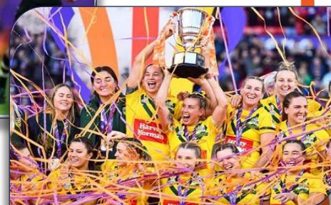
La joie des Jillaroos brandissant le Trophée