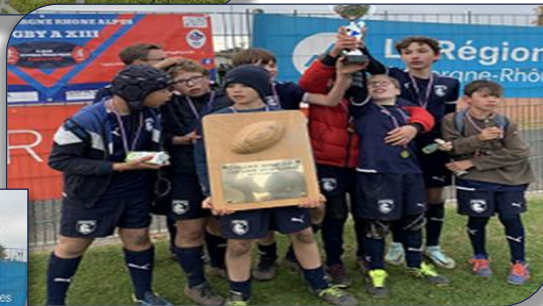
Les U13 de SFRL avec le trophée et le bouclier