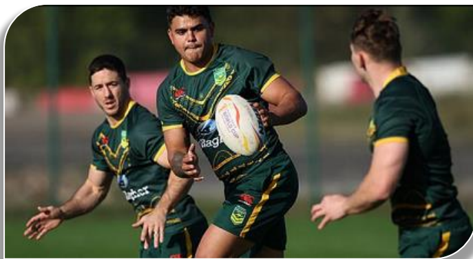
L'attaque des Kangourous moins en vue face aux Kiwis