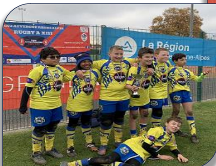
le sourire des U13 de DRL qui ont failli rafter la 1re place