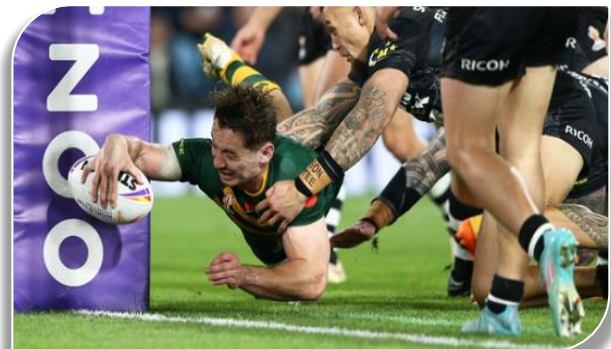
un essai Australien au milieu de 3 kiwis